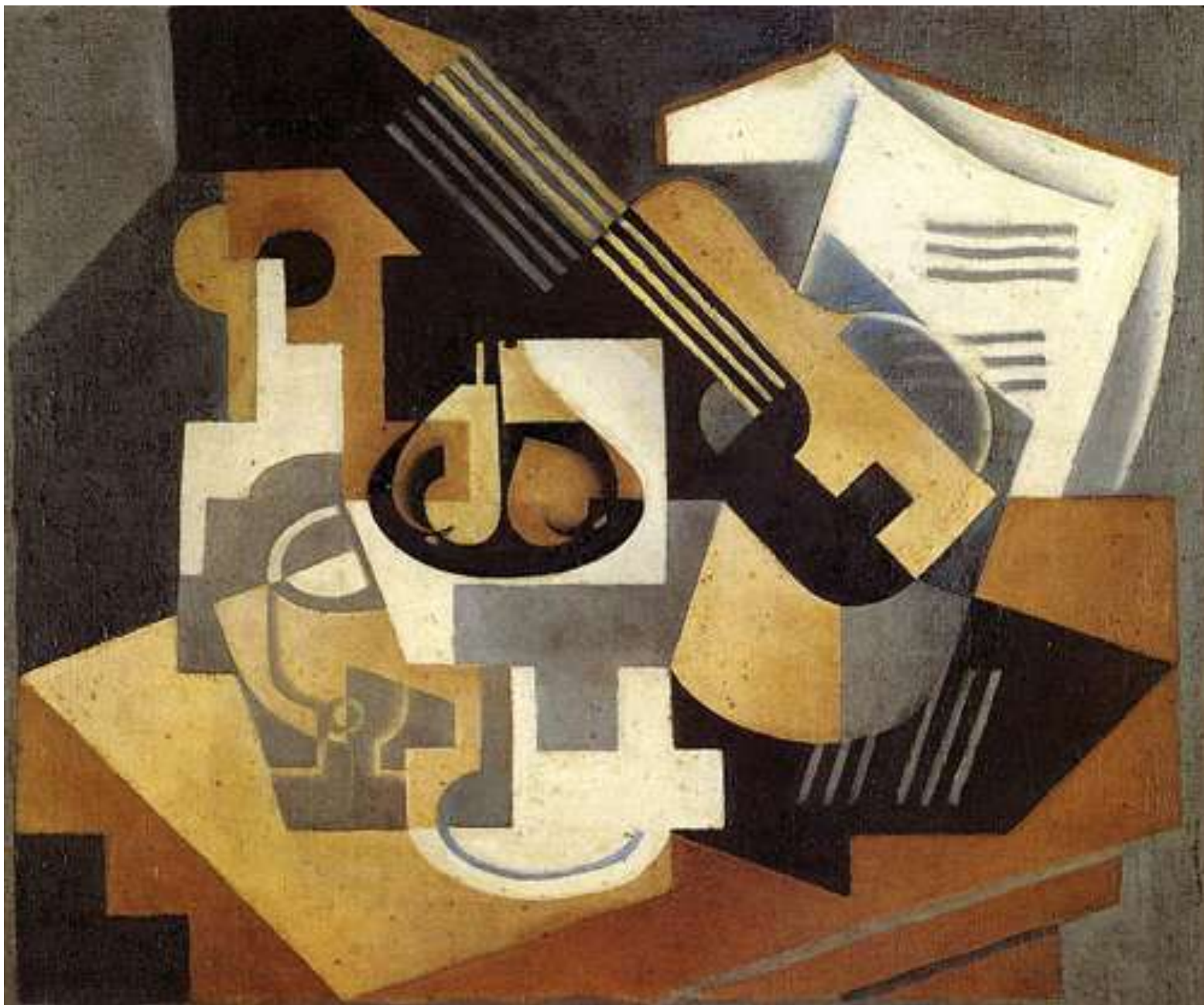
Gitara ir indas vaisiams. Ch. Grisas