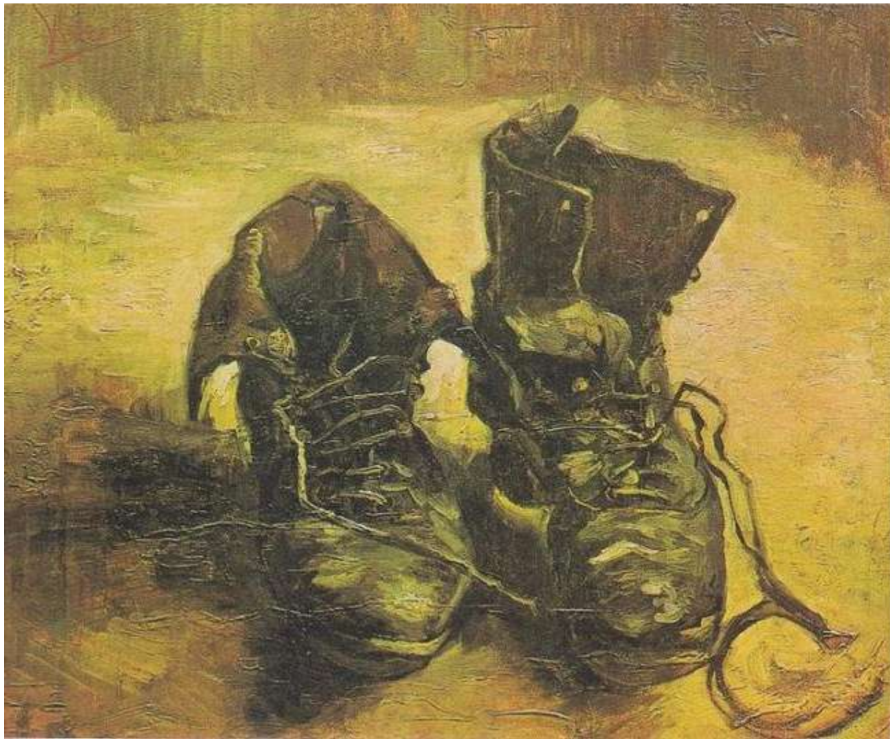
Pora batı. V. van Gogas