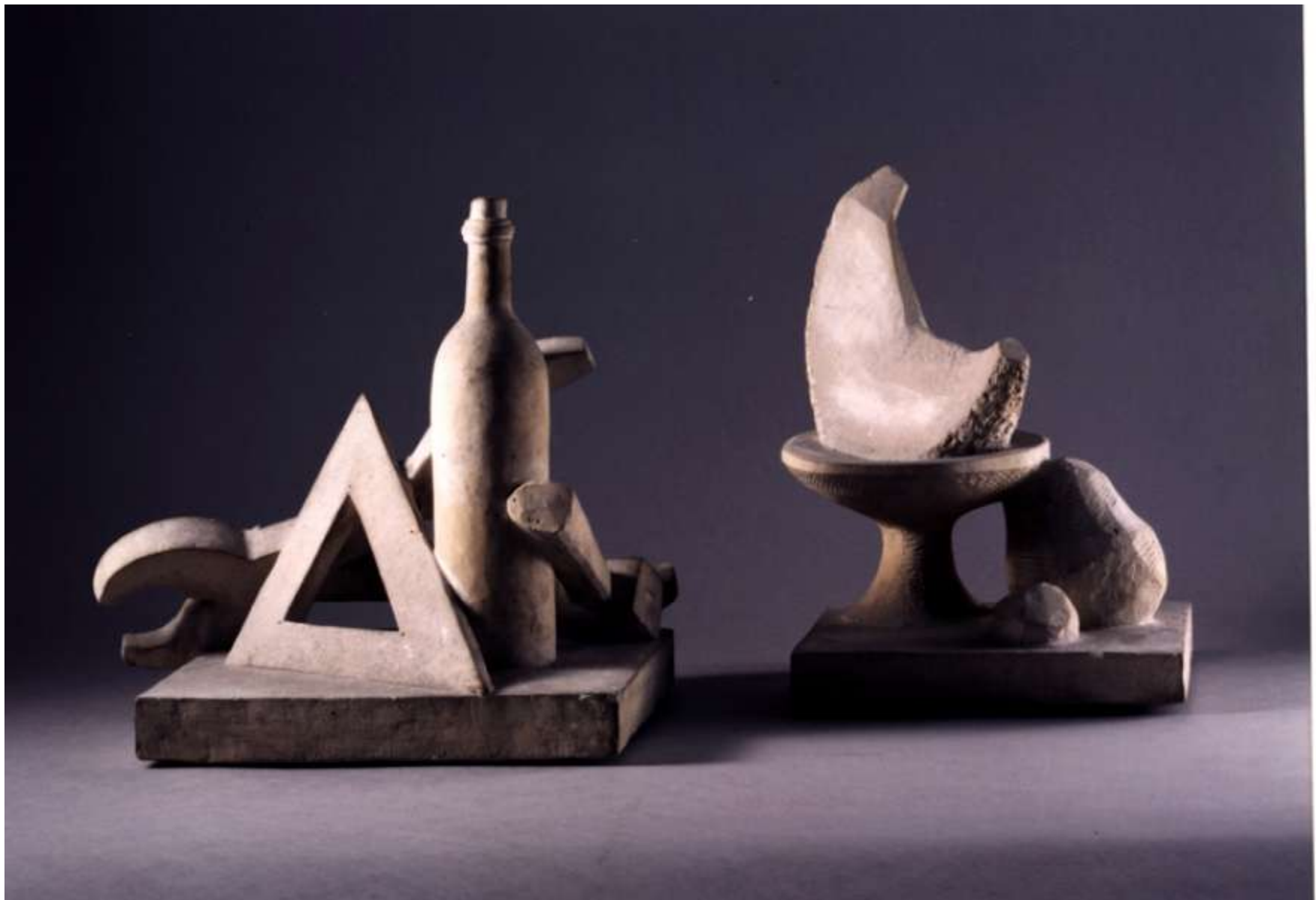
Robert COUTURIER. Natiurmortas su meliono gabalu “. Bronza.