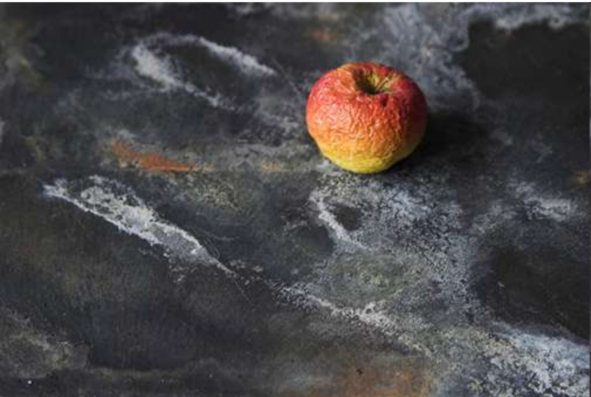
Natiurmortas. Parengė dailės mokytoja ekspertė Virginija Armanavičienė