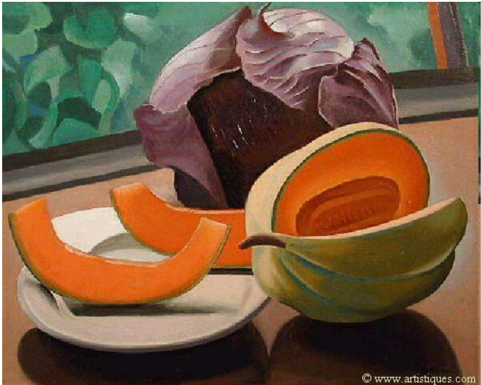
Auguste Herbin, Natiurmortas su melionu