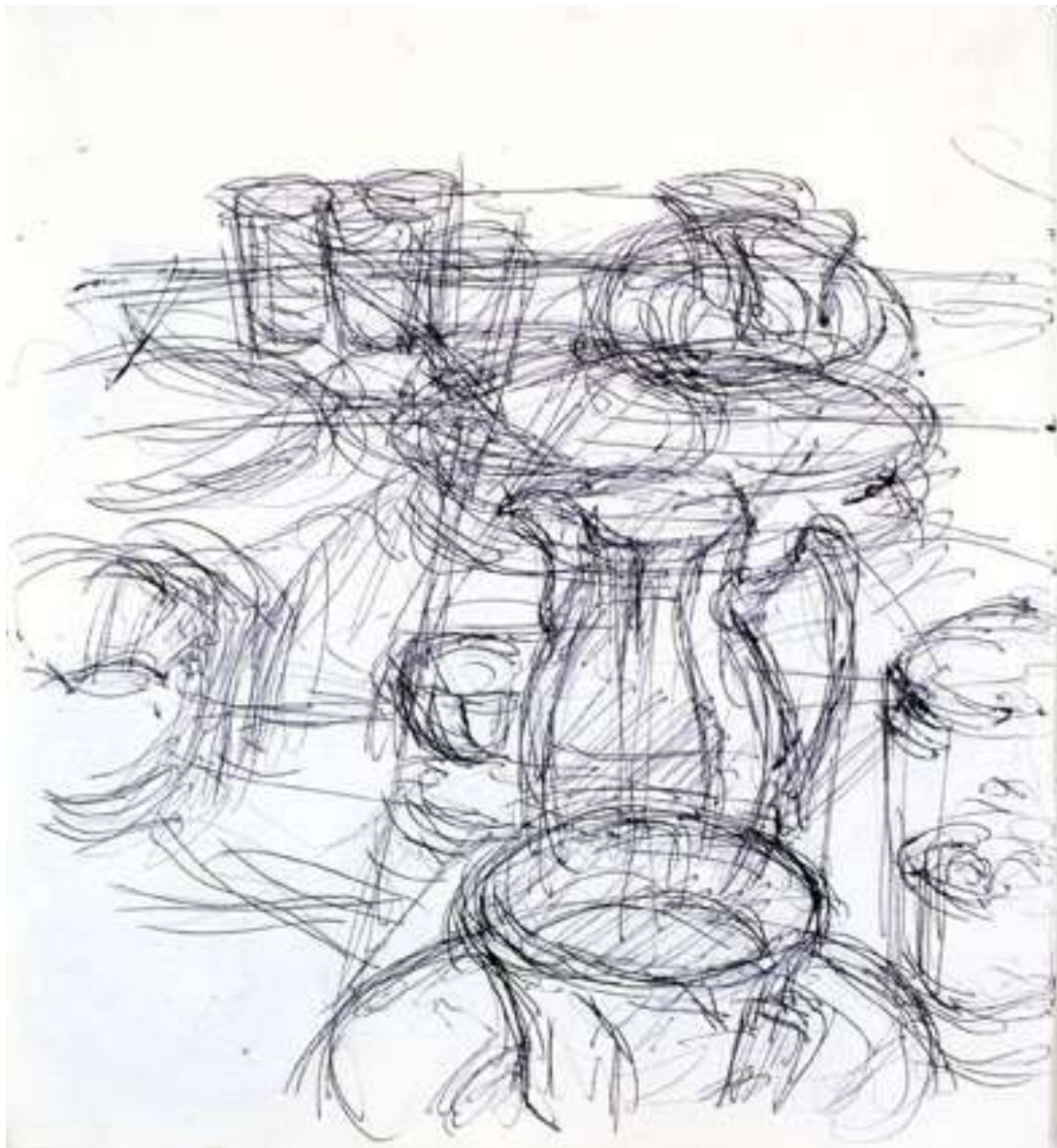
Alberto Giacometti – Natiurmortas su ąsočiu (1965)